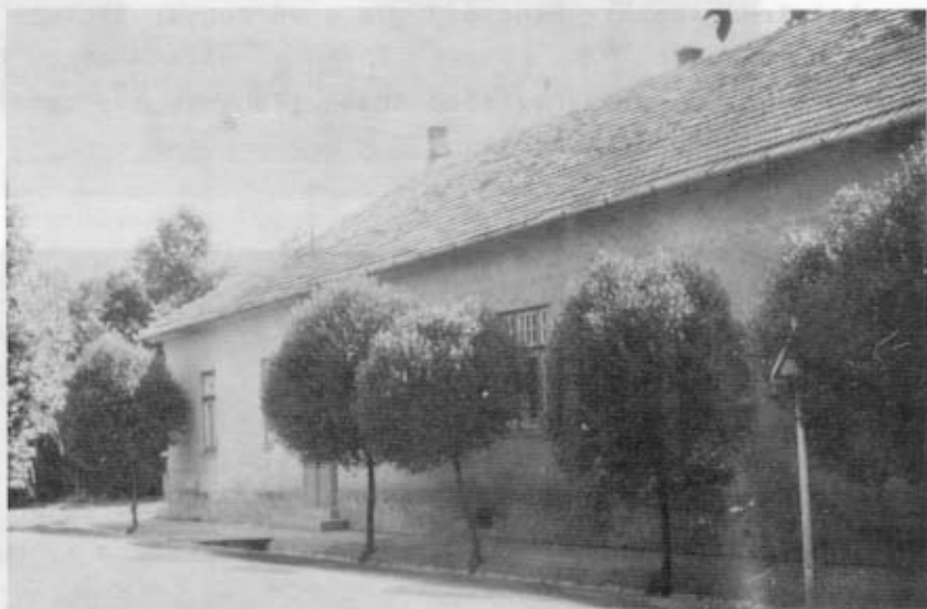
A tiszalöki "Szarvas"-patika egykori épülete /ma: Üregek Napközi Otthona/